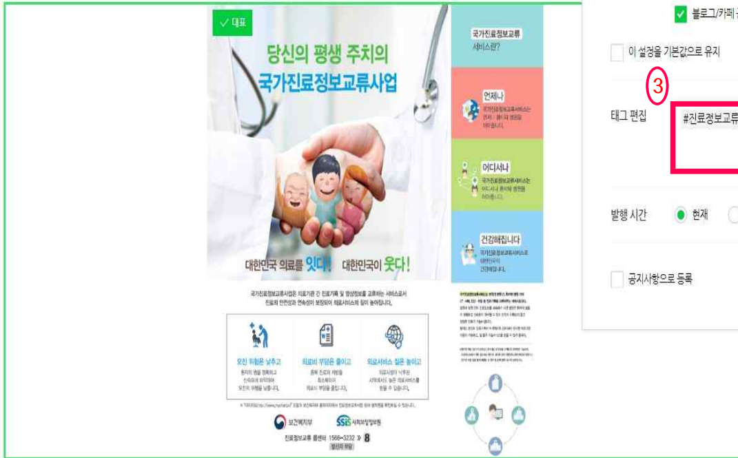
사진 설명을 입력하세요.